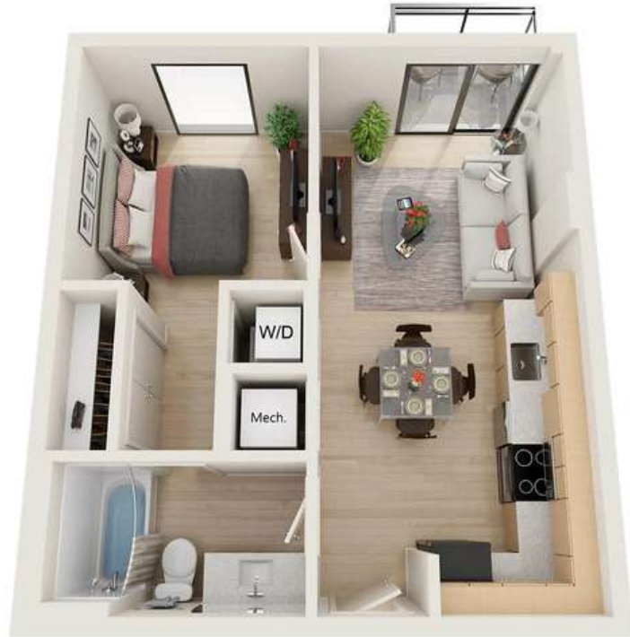
Renderings are an artist's conception and are intended only as a general reference.