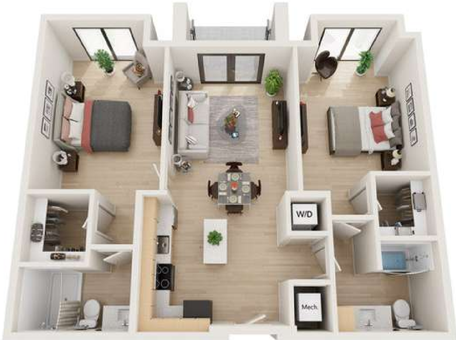
Renderings are an artist's conception and are intended only as a general reference. Features, materials, finishes and layout of subject unit may be different than shown. 3DPlans.com