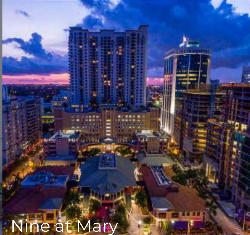
Nine at Mary