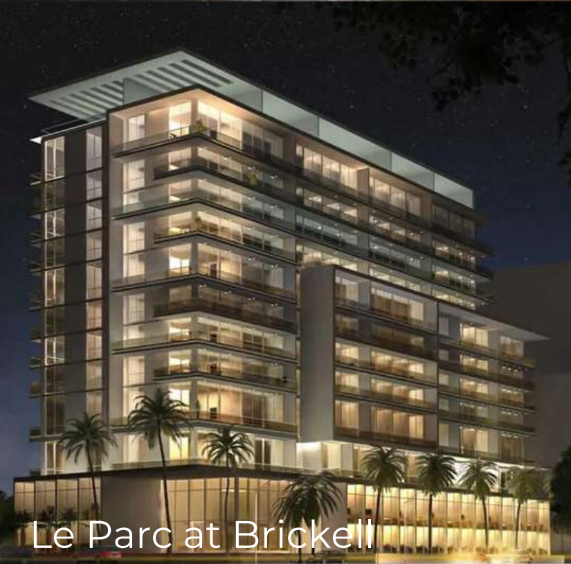
Le Parc at Brickell