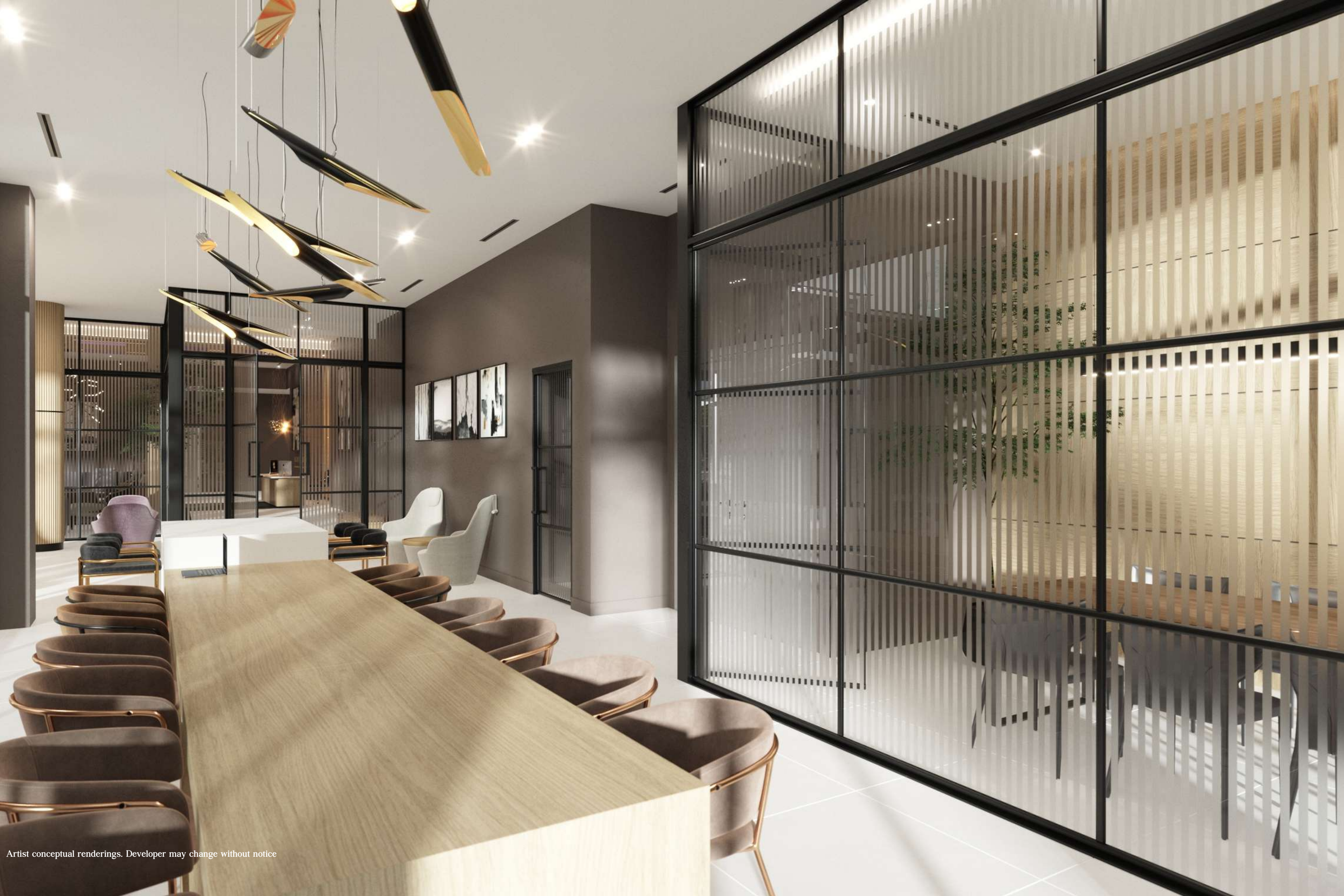
Artist conceptual renderings. Developer may change without notice