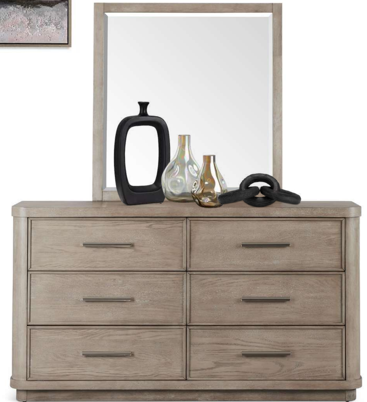
MONICA BEIGE QUEEN PLATFORM BED SOHO NIGHTSTAND SOHO DRESSER WITH MIRROR