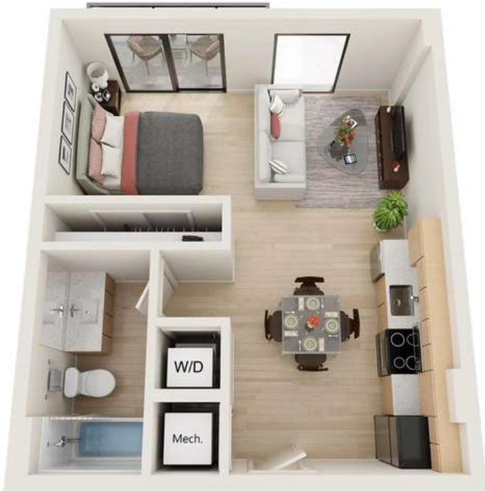
Renderings are an artist's conception and are intended only as a general reference. Features, materials, finishes and layout of subject unit may be different than shown.